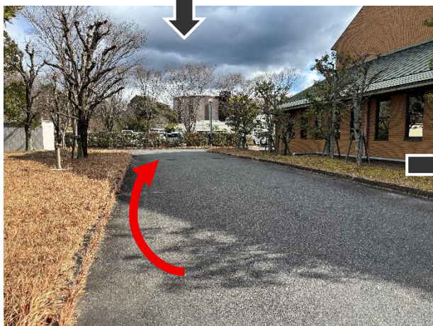
③つきあたりを右折