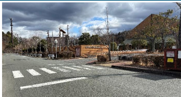
①障害者福祉センターの敷地に入る