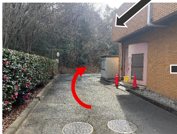
⑤つきあたりを右折 ※狭いので注意