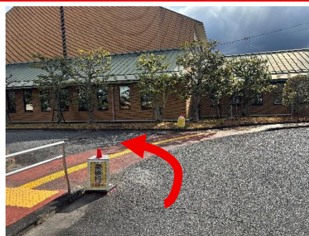
②入ったらここを左折