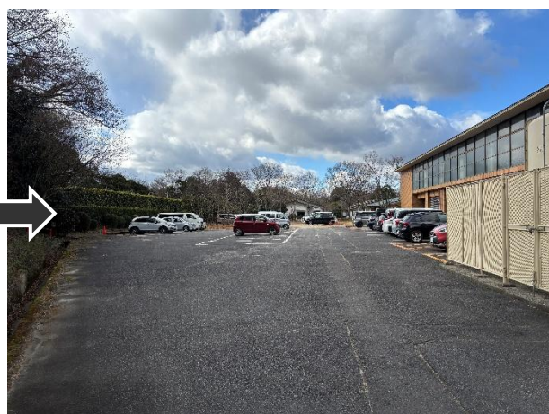
⑥プール裏駐車場に到着